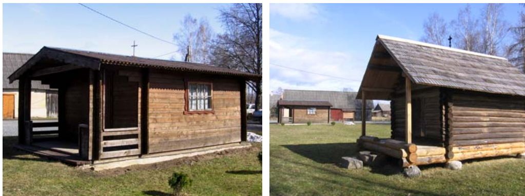
Foto 6 ja 7. Mikitamäe uus (ehitatud 1998, Mikitamäe vald) ... ja vana tsässon (1694?, Mikitamäe vald)

Tänapäeval on tsässonate roll selgelt muutumas. Kadunud on mitmed traditsioonilised funktsioonid külaühiskonnas. Tsässonatesse ei tooda enam surnuid; tsässonate ukseid, mis ajalooliselt olid kõigile avatud, on nüüd enamasti lukus. Kord aastas toimuv külapüha toob aga tsässonate juurde kokku inimesi üle Eesti. Sellest on saanud üks elemente, mis seob tänapäeval ühiseid setu juuri tunnetavat kogukonda nii Setumaal kui väljaspool seda, põlvkondadest sõltumata. Võib öelda, et tsässonatel on praegust setu identiteeti toetav roll.