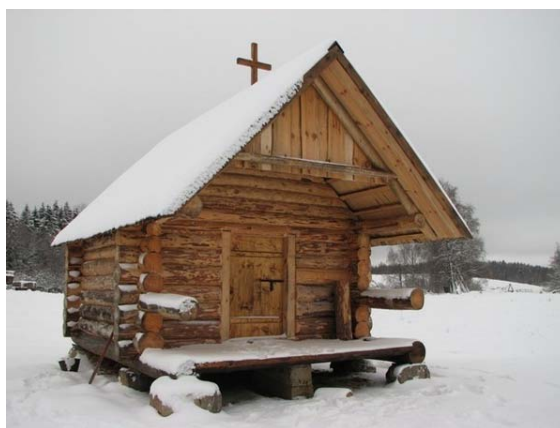
Foto 8 (vasakul). Võmmorski uus tsässon (ehitatud 1999, Meremäe vald)